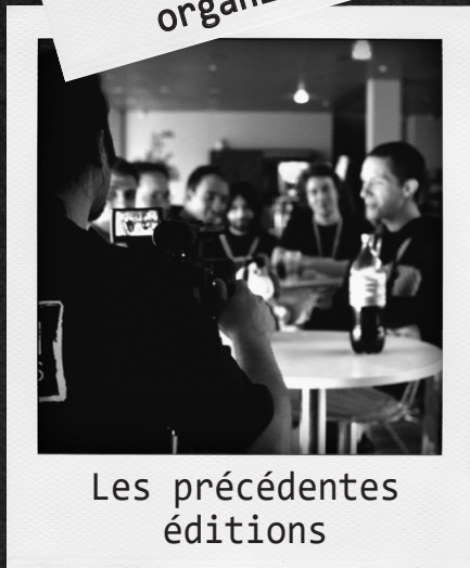
Les précédentes éditions