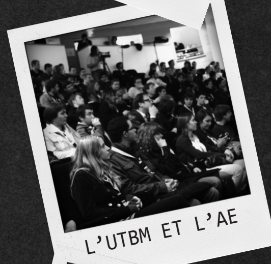
L'UTBM ET L'AE