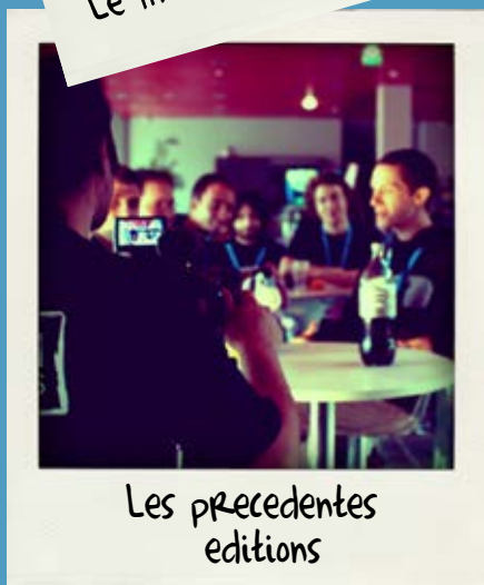
Les précédentes éditions