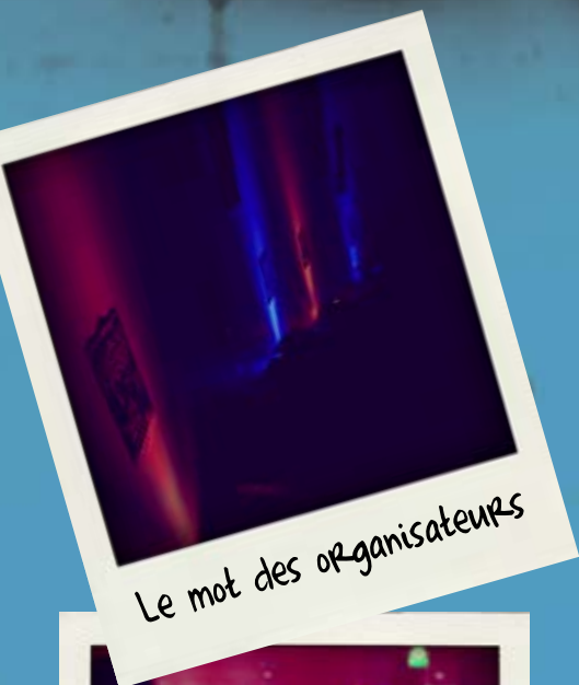
Le mot des organisateurs

UNIVERSITÉ DE TECHNOLOGIE DE BELFORT-MONTBÉLIARD