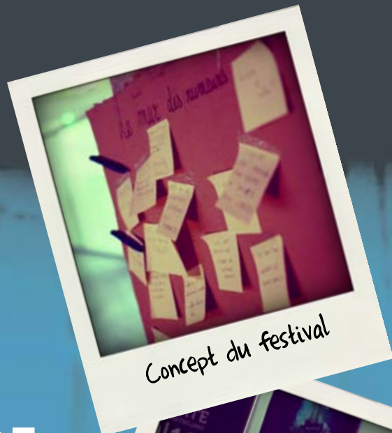
Concept du festival